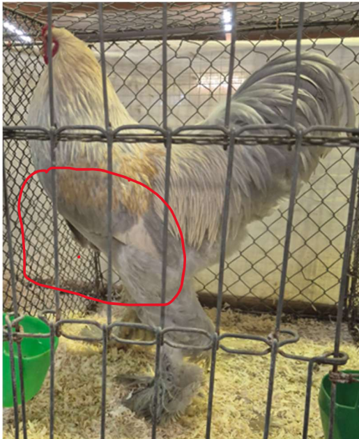
Fehlende Brusttiefe / Unterline

Auch dieser Farbschlag war von der Tierzahl in dieser Saison sehr gut vertreten. Vorzüge bei den Hähnen waren verbesserte Kämmen allerdings muss auch in der Zukunft weiterhin auf dieses Merkmal des Erbsenkammes geachtet werden. Vereinzelt wurden zu große Tiere gezeigt mit einem untypischen großen, langen oder offenen Schwanzabschluss. Leider fehlte bei einigen die Brusttiefe und volle Unterlinie. (siehe Bild) hier muss eine Verbesserung angestrebt werden. Solche Tiere kommen nicht mehr in den SG-Bereich. Die Federbreite in den Steuerfedern waren auch dieses Jahr vielfach ein Wunsch. Einige zeigten hier eine schmale lange Feder. Weitere Wünsche waren zartere Kämmen bei den Hähnen sowie ein typischerer Kammauslauf ohne spitzen Auslauf. Die Hennen waren alle von der Größe in Ordnung. Verbessert hat sich auch in diesem Farbschlag der typische dreireihige Erbsenkamm. In der Form bei den Hennen wird mehr Anstieg im Rücken gefordert. Die Bänderung sollte noch wesentlich markanter und deutlicher sein, viele hatten eine Bänderungsfeder ohne Bänderungsanlagen. Dies muss auch weiterhin verbessert werden. Auf eine satte Lauffarbe ist auch weiterhin zu achten.