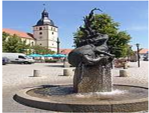
Sagenbrunnen und Stadtpfarrkirche

Tirschenreuth, der für seine bekannte Fischzucht auch das Land der tausend Teiche genannt wird, befindet. Hier begrüßen Euch neben der wunderschönen Natur (wie z.B. der Naturpark Steinwald oder das Waldnaabtal) auch bekannte Sehenswürdigkeiten (die Stiftsbasilika in Waldsassen, die Wallfahrtskirche Kappl oder der Reslgarten in Konnersreuth).