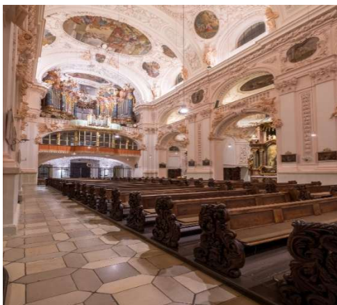
Blick zur Empore