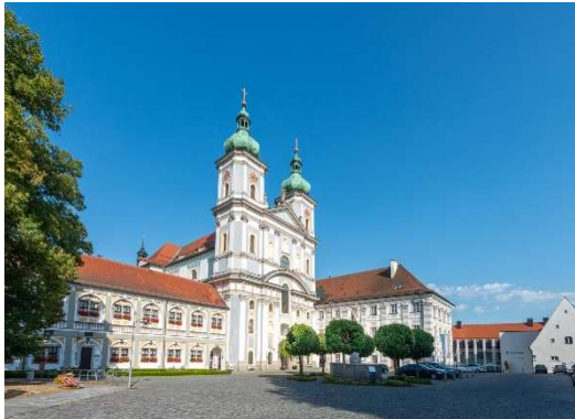
Stiftsbasilika in Waldsassen